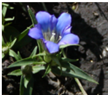
リンドウ (熊本の花) (根を竜胆)