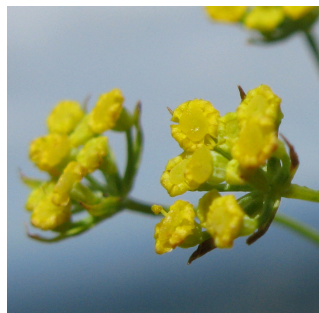
ミシマサイコ (根を柴胡)