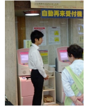
↑ ↑ 自動再来機：再診の患者さんの受付を行う機械。