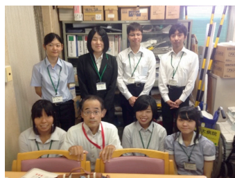
←病院スタッフの方と

謝辞 今回、ボランティア活動を受け入れてくださった熊大病院の方々、大変お世話になりました。ありがとうございました。